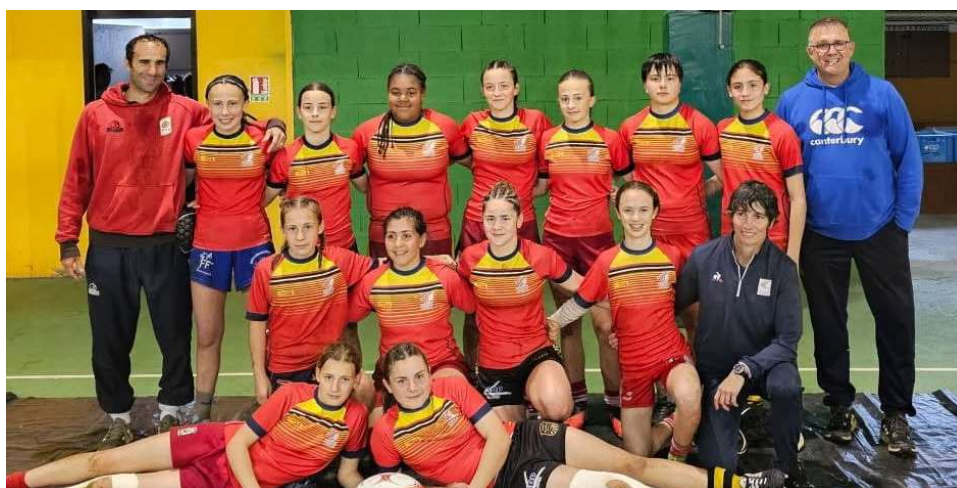
M15 filles Briatexte