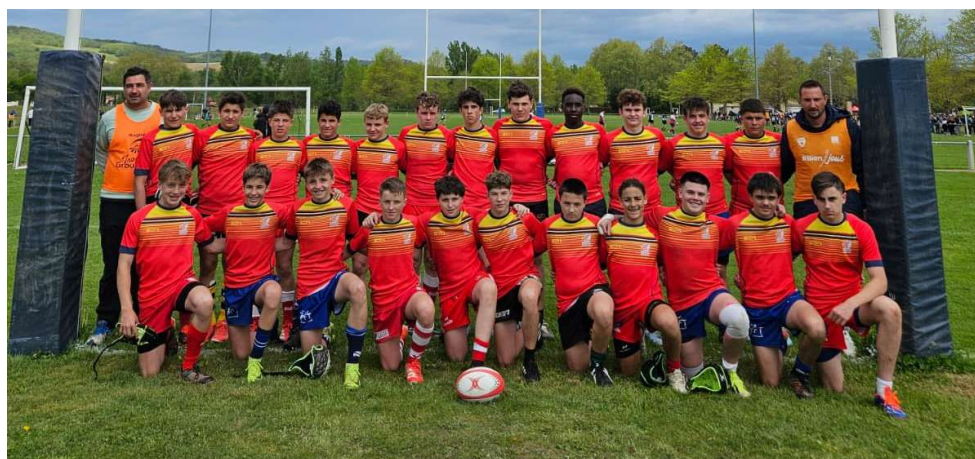
M14 garçons Graulhet

Malheureusement la forte pluie et surtout l'orage ont dû stopper le tournoi vers 15 heures. Les filles avaient participé à quatre rencontres pour quatre victoires. Les garçons quant à eux avaient deux victoires et une défaite.